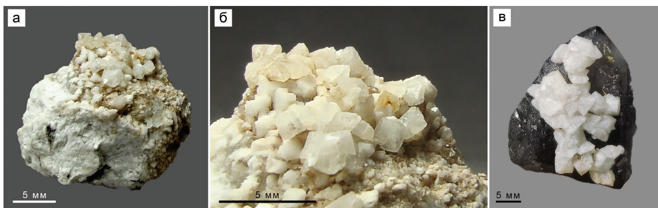
Рис. 3. Гускрикит и ассоциирующие минералы из Булатовского карьера: а – бесцветные кристаллы гускрикита и более мелкие белые кристаллы микроклина на белом массивном микроклине в сростании с кварцем и темным клинохлором; б – увеличенный фрагмент образца на рис. 3а; в – белые кристаллы гускрикита на дымчатом кварце.

Fig. 3. Goosecreekite from the Bulatovo quarry: а – colorless goosecreekite crystals and smaller white microcline crystals on white massive microcline and quartz with dark clinocllore; б – enlarged fragment of specimen from Fig. 3а; в – white goosecreekite crystals on smoky quartz.