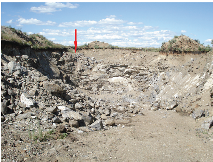
Fig. 2. Pegmatite body in the Bulatovo quarry, where goosecreekite was found (shown with an arrow). Field of view ~20 m. July 2025.

Рис. 2. Пегматитовое тело Булатовского карьера, в котором найден гускрикит (указано стрелкой). Поле зрения ~20 м. Июль 2025 г.